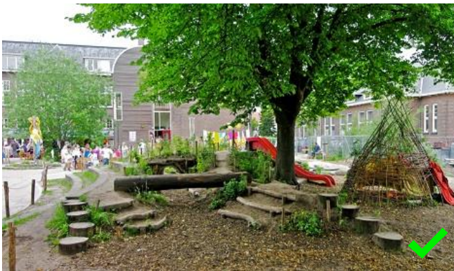
Speelaanleiding = wel subsidiabel

Een speeltoestel is een object met een specifieke speelfunctie die als zodanig is geplaatst op het schoolplein. Bij een speelaanleiding is sprake van vrij spel, er is geen specifieke speelfunctie te duiden. Kinderen bepalen zelf op welke manier zij de speelaanleiding gebruiken.