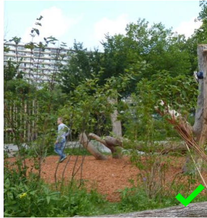
Onthard oppervlak (natuurlijk)