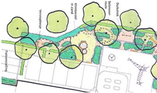
Groen casco: alle beplanting