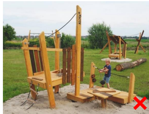
Speeltoestel = niet subsidiabel